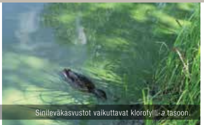
Sinileväkasvustot vaikuttavat klorofylli-a tasoon.