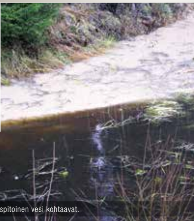
Savipitoinen ja humuspitoinen vesi kohtaavat.