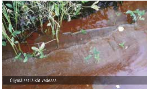
Öljymäiset läikät vedessä